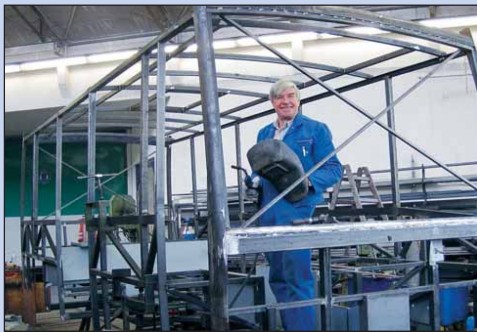
So sieht der Elektrobuss im Rohbau aus.

Die Lieferung des neuen Elektrobusses erfolgt voraussichtlich im Herbst 2009. Geplant ist, dass er in der kommenden Wintersaison seinen Dienst auf der Linie Winkelmatten aufnehmen wird.