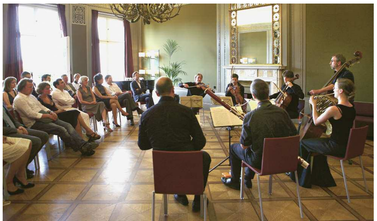
Kammermusik vom Feinsten.