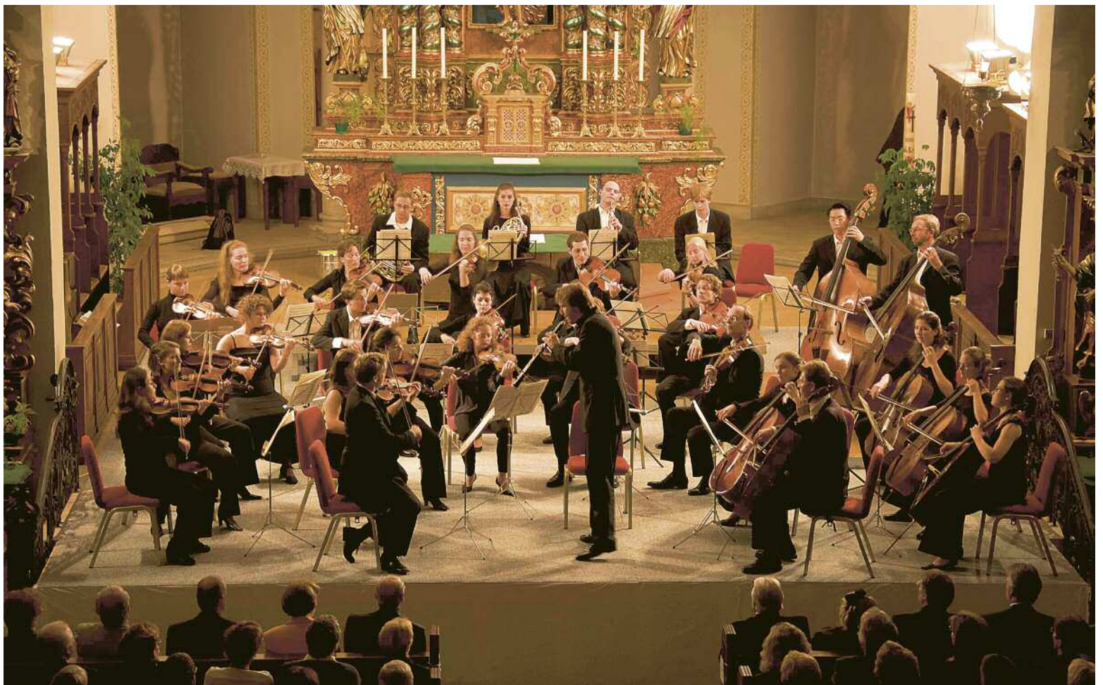
Orchesterkonzerte mit erstklassiger Besetzung sind in der Zermatter Pfarrkirche Mauritius zu hören.

Die Konzerte auf der Riffelalp sind stets ausverkauft, das Gleiche wünscht sich die Festivalleitung für die Aufführungen in der Dorfkirche St. Mauritius. » Seite 2