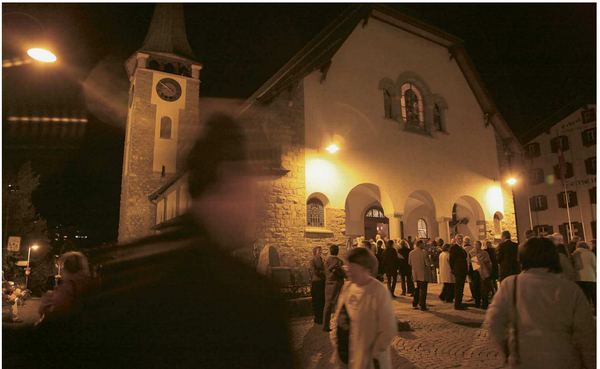
Das Zermatt Festival ist ein gesellschaftliches Ereignis.