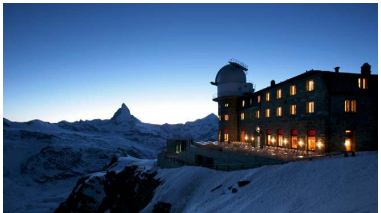
Das 3100 Kulmhotel Gornergrat «Summit Experience» – ein besonderes Erlebnis.