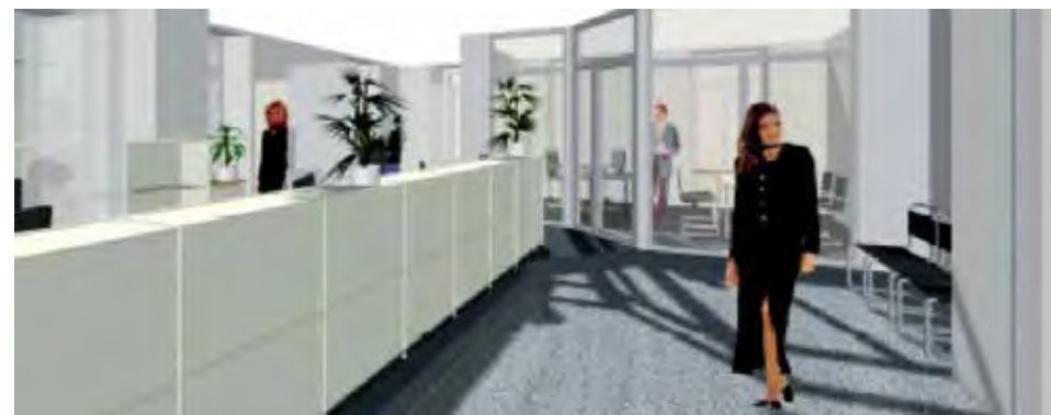
Die Büros werden modern und kundenfreundlich gestaltet.

Das Team unter der Leitung von Bernarda Perren ist stets bemüht, die Kunden freundlich und zuvorkommend zu bedienen. Es sucht die Bürgernähe und durch persönliche und kompetente Beratung anhand der gesetzlichen Grundlagen ist es stets bestrebt, die richtige Lösung zu finden.