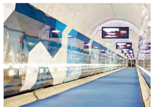
Audi nutzt sämtliche Bildschirme im Tunnel der Standseilbahn Sunnegga.

So zeichnet sich die Zermatt Bergbahnen AG beispielsweise durch ihren auf Nachhaltigkeit ausgerichteten Umgang mit den natürlichen Ressourcen aus. Die hohen Umweltinvestitionen, das höchstgelegene Minergie-zertifizierte Gebäude der Welt und zahlreiche Fotovoltaik-Anlagen zeugen eindrücklich von dieser Philosophie. Hohe Ansprüche an Technologie und Qualität sind Werte, die für die Zermatt