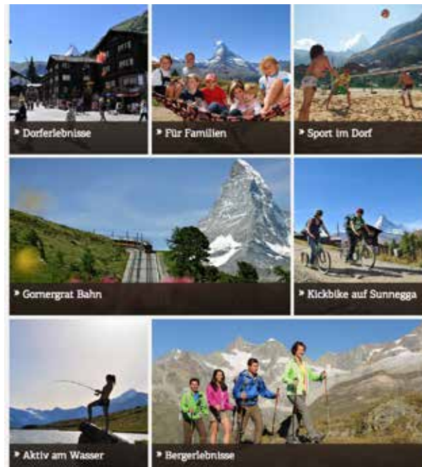
Die präsentierten Erlebnisse inspirieren mit Bildern.

Ferienwohnungen entwickelt. Für den Gast sind neu sofort die Verfügbarkeiten und die Preise ersichtlich. Und natürlich kann sofort gebucht werden. Auch die Darstellung des Wetters ist ausgebaut. Brandneu sind zudem die Zehntagesprognosen. Hinzu kommen Angaben zu den Wetterverhältnissen bei Bergbahnstationen. Und wie bisher zeigt die Panoramakarte live die geöffneten Bergbahnabschnitte.