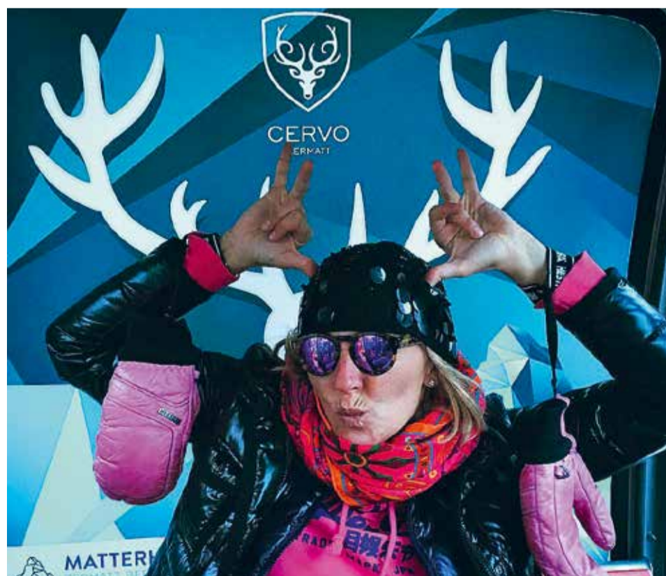
Der Gast mit dem originellsten Selfie gewinnt die allerletzte Kult-Gondel.