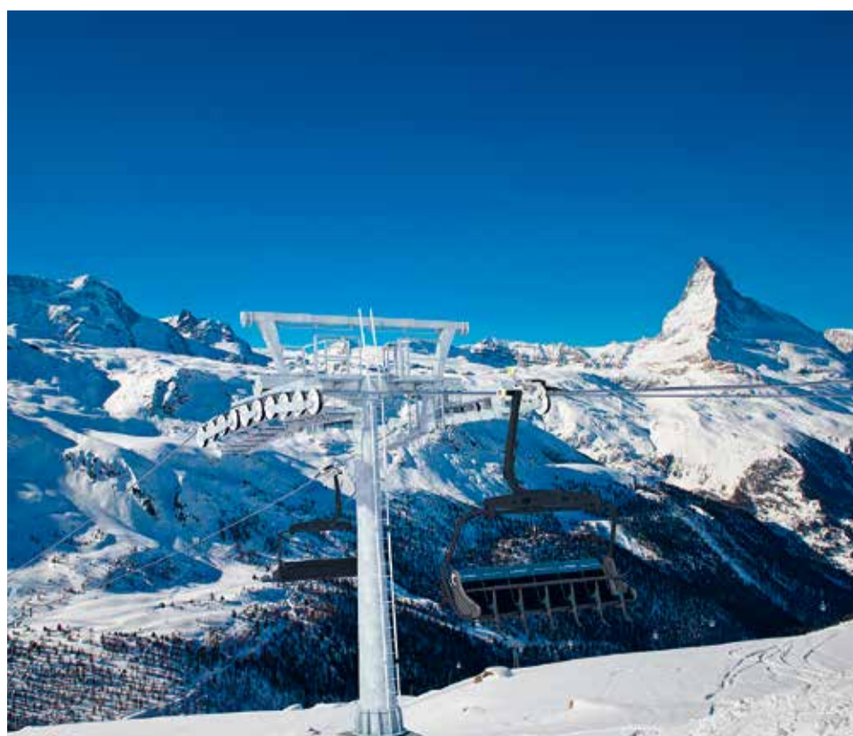
Acht Stützen zählt die neue Sesselbahn Gant-Blauherd.