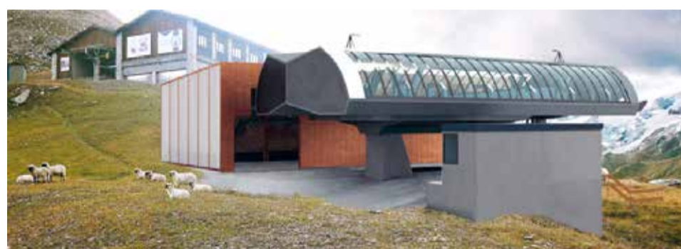
Die neue Bergstation kommt direkt unterhalb der Bergstation Patrollarve zu stehen.