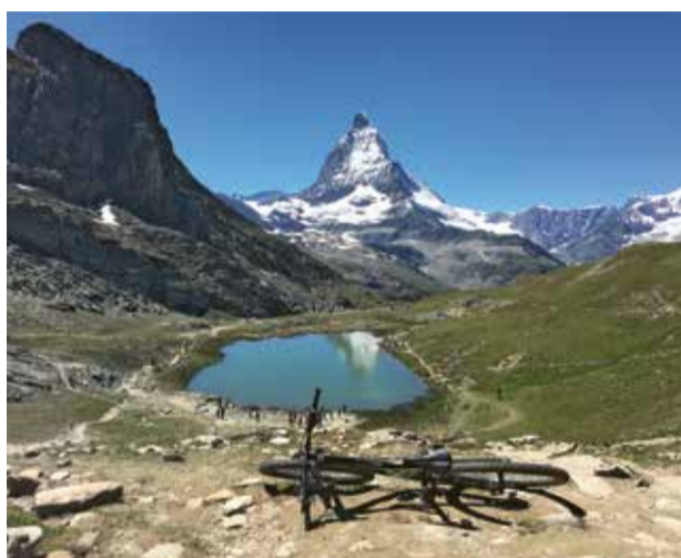
Nach dem technisch anspruchsvollsten Teil dieser Tour folgt unweigerlich auch schon der nächste Stopp. Der Riffelsee mit der Matterhorn-Spiegelung ist immer wieder einen Halt wert.