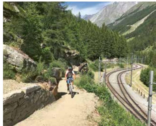
Der Wanderweg zwischen Zermatt und Täsch ist nun hervorragend ausgebaut und bietet genügend Platz für Wanderer und Biker.