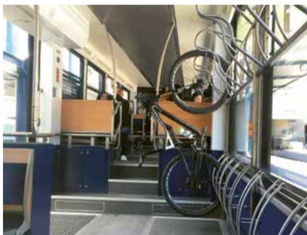
Die Fahrt mit der Gornergrat Bahn auf den Gornergrat oder zum Riffelhaus 1853 mit dem Bike ist problemlos. Es hat genügend Platz für die Bikes in den Bahnwagen.