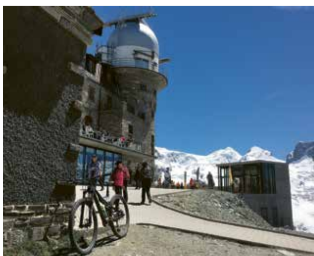
Start einer der wohl längsten Bike-Abfahrten, auf knapp 3100 mü. M. vor dem Kulmhotel Gornergrat.