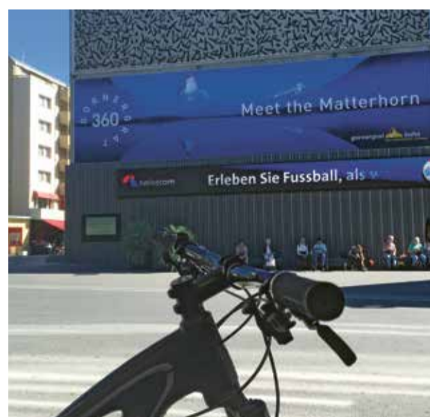
Ziel Bahnhof Visp erreicht und gleich locken wieder das Matterhorn und die endlosen Bike-Trails am Gornergrat. Retour nach Zermatt geht es gemütlich mit der Matterhorn Gotthard Bahn oder wer will, kann auch gleich wieder mit dem Bike zurückfahren.