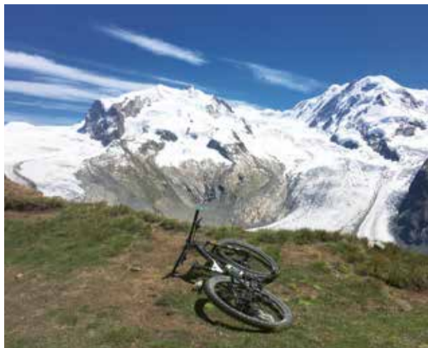
Kurz nach dem Start auf dem Gornergrat kann man nicht anders und muss einen ersten Stopp machen. Diese Aussicht auf das Monte-Rosa-Massiv ist einfach zu einzigartig.