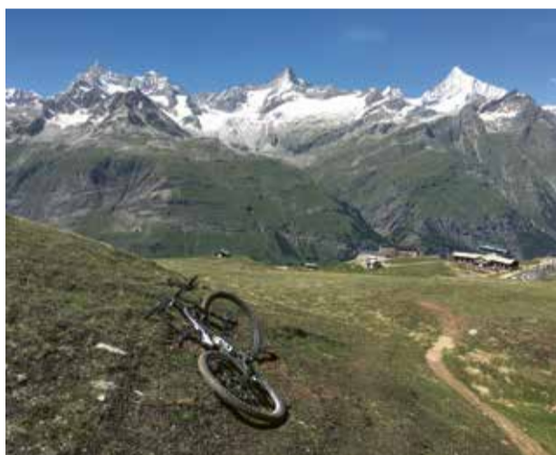
Ein kurzer Stopp auf dem Riffelberg, um die Aussicht zu geniessen und festzulegen, welcher der vielen Trails nun unter die Räder genommen werden soll.