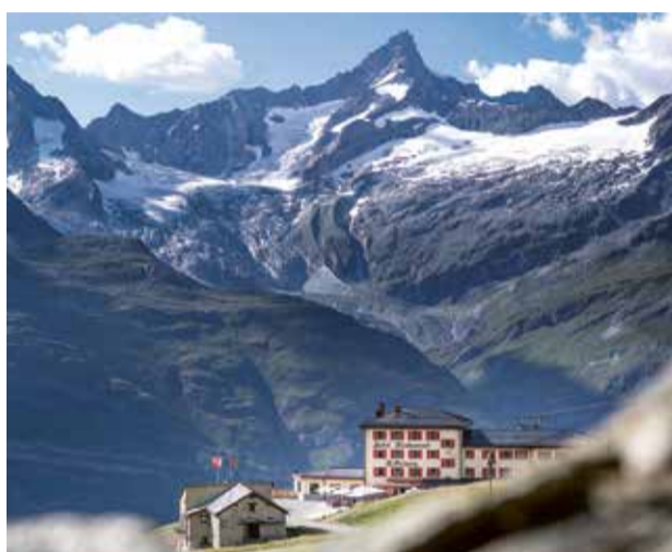
Das offizielle Bike-Hotel Riffelhaus 1853 mitten im Bike Paradise am Gornergrat ist der Ausgangspunkt für diese Tour.

Ausgangspunkt für diese Bike-Tour ist das Riffelhaus 1853, mittendrin im Bike Paradise Gornergrat. Es ist seit diesem Jahr offizielles Bike-Hotel von Schweiz Tourismus und zielt auch das Titelbild des offiziellen Bike-Hotel Führers. Nach einer erholsamen Nacht im neu umgebauten 4*-Bike-Hotel und einem reichhaltigen Frühstück geht es am Morgen los.