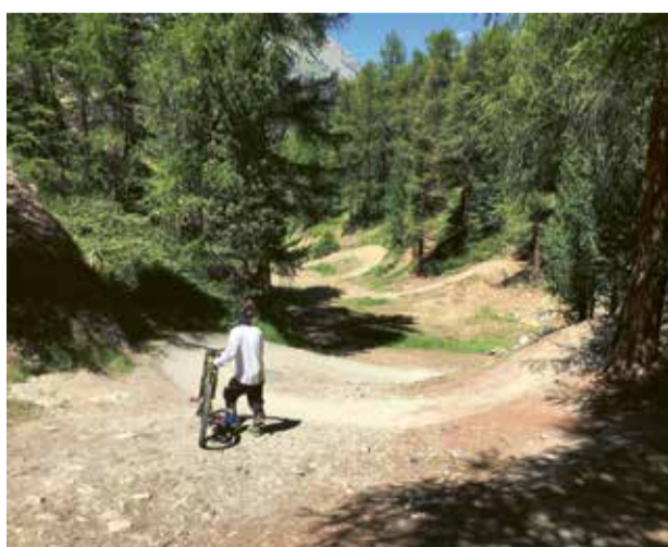
Der auf diesen Sommer hin neu erstellte Moostrail zwischen Furi und Winkelmaten ist harmonisch in die Landschaft eingefügt und zum Biken ein Genuss.