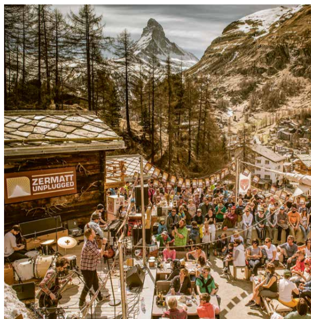
Stimmung bei der New-Talent-Bühne beim Mountain Boutique Resort Cervo.