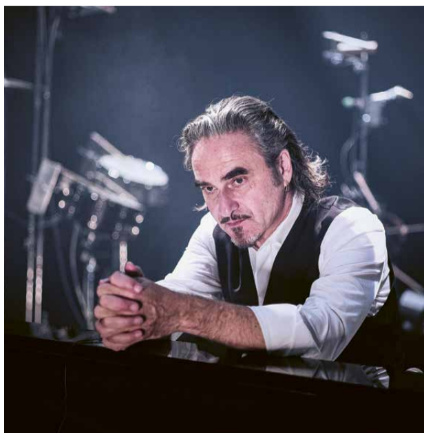
Im Grand Chapiteau, dem grossen Zelt, treten die internationalen Stars auf: Stephan Eicher.

Sitzecken, Holzdächer, die Unplugged-Musik von der Bühne und gar ein Ort zum Würstibräteln machen das Taste Village zum Schmelztiegel der Genüsse: man sitzt zusammen, wärmt sich an Feuerstellen, trifft sich auf einen Schwatz, auf ein Häppchen, auf die Musik eines New Talents oder für eine Verschnaufpause. Und dann geht es wieder weiter, zu den Konzert-Locations: ins Grand Chapiteau, ins Vernissage, ins Alex oder auch in die Höhe auf Sunnegga. Zermatt im Frühling, das ist etwas ganz Besonderes – gegen Abend entsteht diese absolut einmalige Geruchskombination aus Schnee und lauer, frühlingshafter Alpenluft. Man hört das Lachen glücklicher Menschen, und immer wieder wehen Gitarren-Riffs und Gesangsfetzen von irgendwoher übers Dorf. Zermatt Unplugged eben.