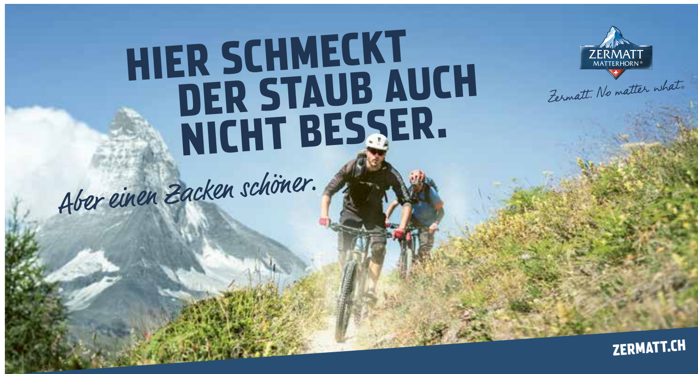
Bis im Oktober sind Banner mit Bikern und Wanderern online zu sehen.

Beeindruckende Natur, aktive Menschen und wirkungsvolle Slogans prägen die neue Werbung von Zermatt – Matterhorn. Zu sehen ist sie bis im Oktober und vor allem online.