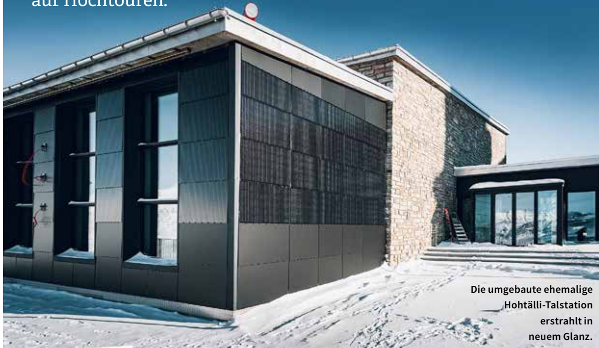
Die umgebaute ehemalige Hohtälli-Talstation erstrahlt in neuem Glanz.

Auf dem Gornergrat entsteht eine multimediale Erlebniswelt rund um das Matterhorn. Im Juni 2021 sollen die ersten Gäste in allen Dimensionen in die naturnahe Inszenierung eintauchen können. Realisiert wird die Ausstellung in der Station der ehemaligen Luftseilbahn «Hohtälli», die Bauarbeiten laufen auf Hochtouren.