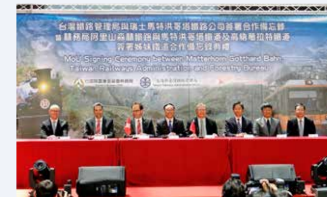
2016 Verschwisterung mit der Taiwan Railways in Taipeh.