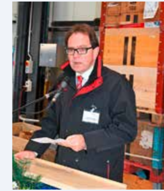
2013 Einweihung Güterumschlag Terminal Bockbart in Visp.