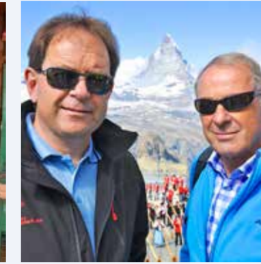
2013 Mit alt Bundesrat Adolf Ogi beim Guinness-Weltrekord mit 508 gleichzeitig spielenden Alphörnern auf dem Gornergrat.