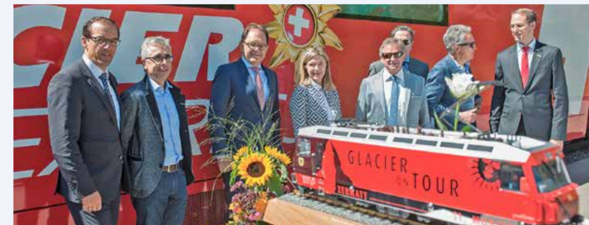
2017 Gründung der Glacier Express AG mit der Partnerbahn Rhätische Bahn.