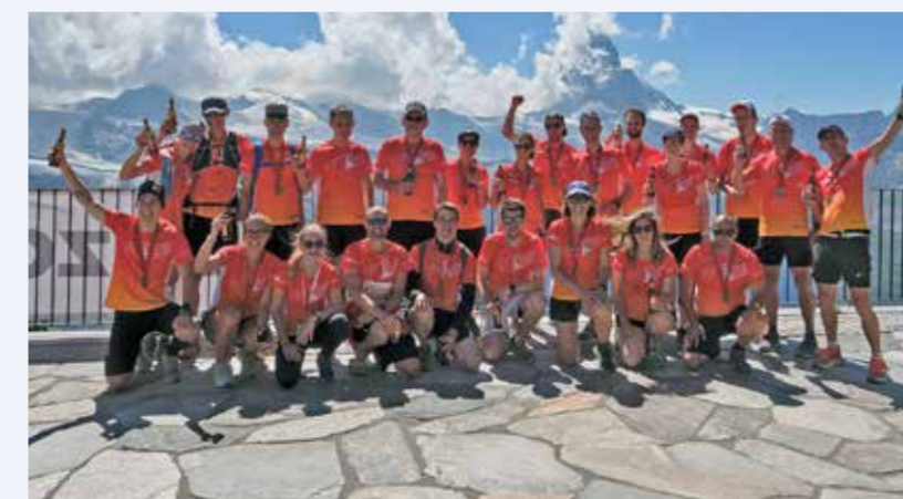
2022 20-Jahr-Jubiläum des Gornergrat Zermatt Marathon.