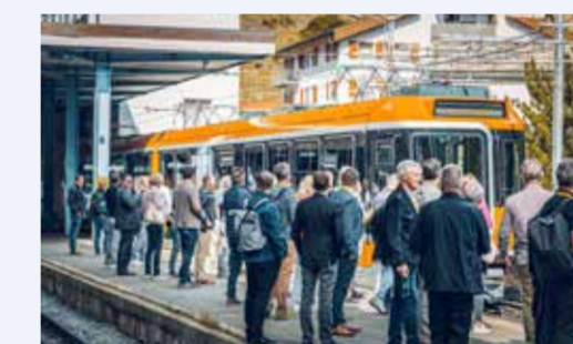
2022 Jungfernfahrt der fünf Gornergrat-Triebzüge POLARIS.