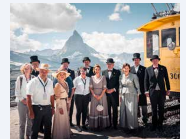
2023 125. Geburtstag der Gornergrat Bahn, der ersten elektrischen Zahnradbahn der Schweiz.

Seit 2014 verantwortet er die Leitung des Bereiches Infrastruktur mit derzeit rund 115 Mitarbeitenden. 2016 übernahm er zusätzlich die Funktion als stellvertretender Unternehmensleiter. Der 50-jährige dipl. Kulturingenieur ETH verfügt über einen Executive MBA mit Vertiefung General Management und einen CAS in Unternehmensführung.