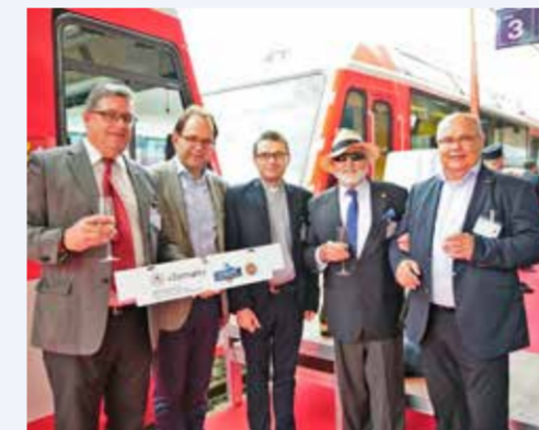
2016 wurden 125 Jahre Bahnstrecke Visp-Zermatt gefeiert.