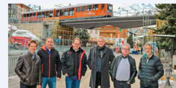
2017 Nach 119 (!) Jahren im Dienst, Einweihung der neuen Getwing-Brücke.